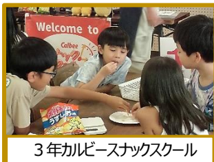
3年カルビスナックススクール