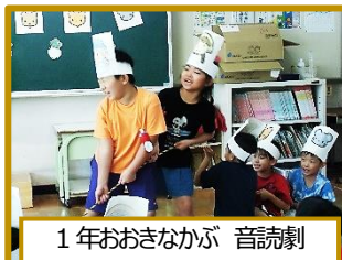
1年おきなかが 音読劇