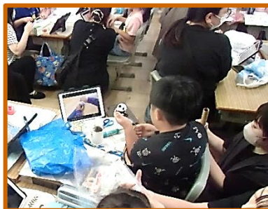
【2年:作って遊ぼう 動くおもちゃ】