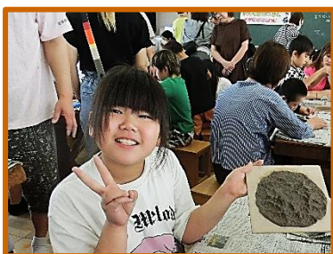
【のぞみ学級:陶芸体験をしよう】

「なりたい自分(夢)」を見つけることや、それを目指して学力をつけたり運動したりすること。自分の夢やがんばっている姿を周りの人が認めてくれること。「なりたい自分」が変わったりなれなかったりしても、新しい「なりたい自分」を見つけられる「くじけない心」をもつこと。そんな自分を家族や友達、先生に「認めてもらうこと」などなど、日々の学校教育活動は子どもたちが将来幸せになるためのものばかりです。子どもたちの「幸せ」のために、本校の教育活動にご理解とご協力賜りますようお願いいたします。