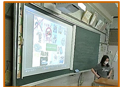
【6年:幸せな未来を考えよう】