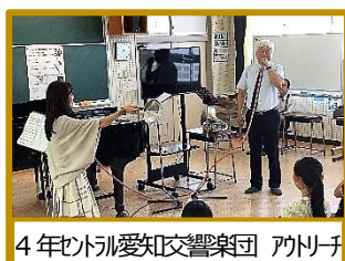
4年サトウ愛知交響楽団 アトリチ