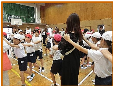
【4年:しあわせニ運動会】