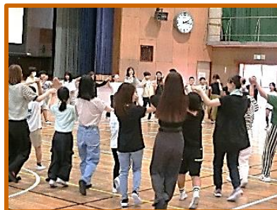
【5年:親子で踊ろう♪フォークダンス】