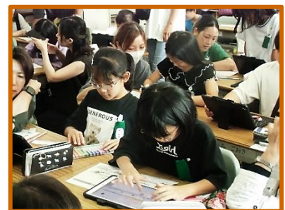
【3年:手前どりPOPを作ろう】