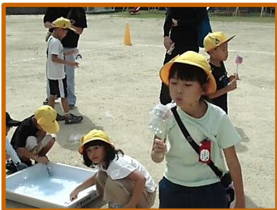
【1年:ハッピー バブリー】

「半田市幸せになるための教育」の授業公開を行いました。公開日には、多くの保護者の皆様にご参観いただき、子どもたちと一緒に活動していただきました。ありがとうございました。岩滑小学校では「なりたい自分になる」「自分のことが認められる」ことが『幸せ』と考え、各担任が授業を準備してきました。