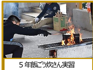
5年飯ごう炊さん実習